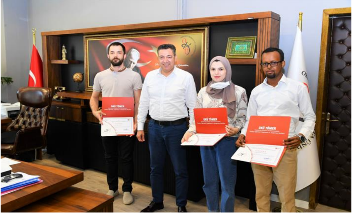
Resim 5: OKÜ TÖMER Katılımcı Sertifika Belge Teslimi