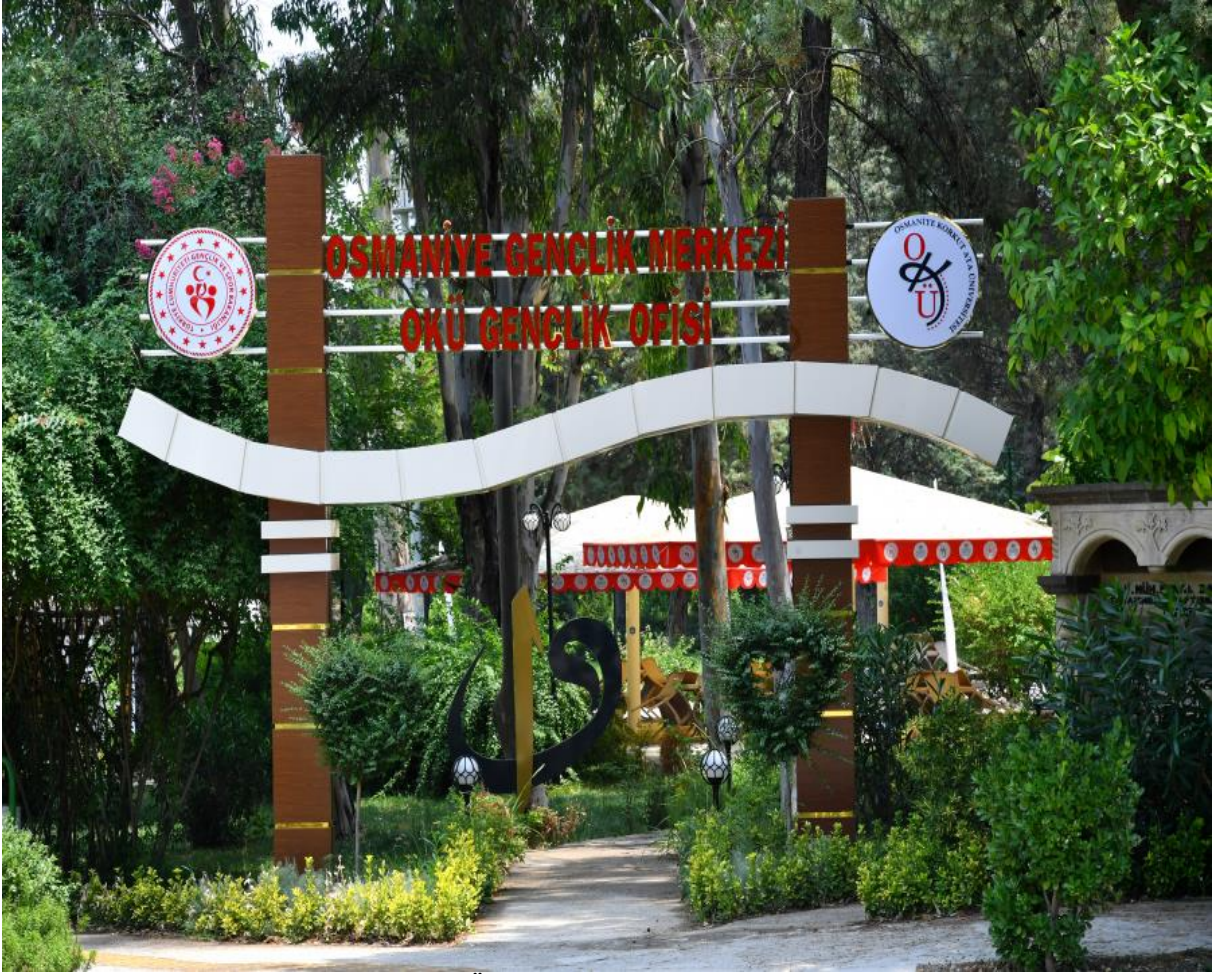
Resim 4: Osmaniye Gençlik Merkezi OKÜ Gençlik Ofisi