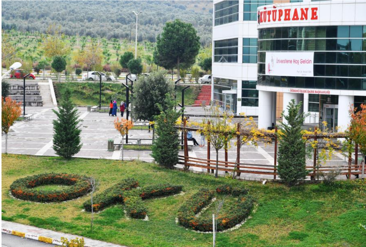
Resim 7: OKÜ Kütüphane