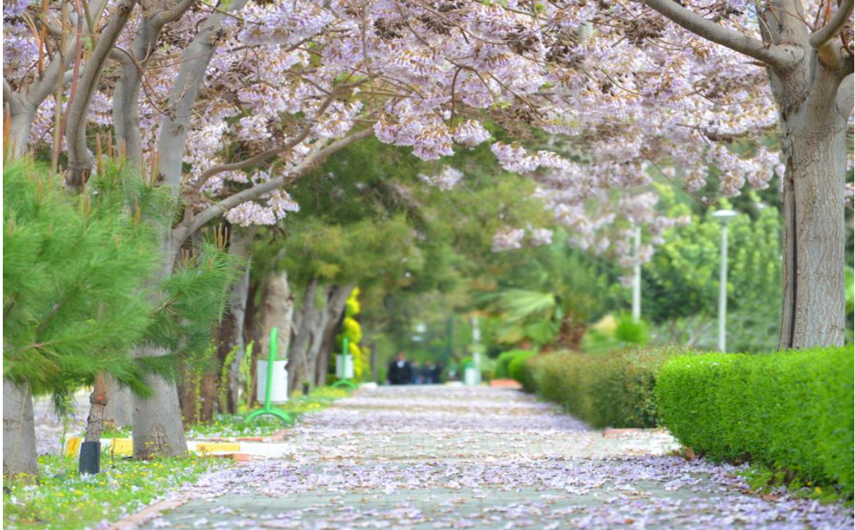
Resim 3: OKÜ Karacaoğlan Yerleşke Alanı İlkbahar