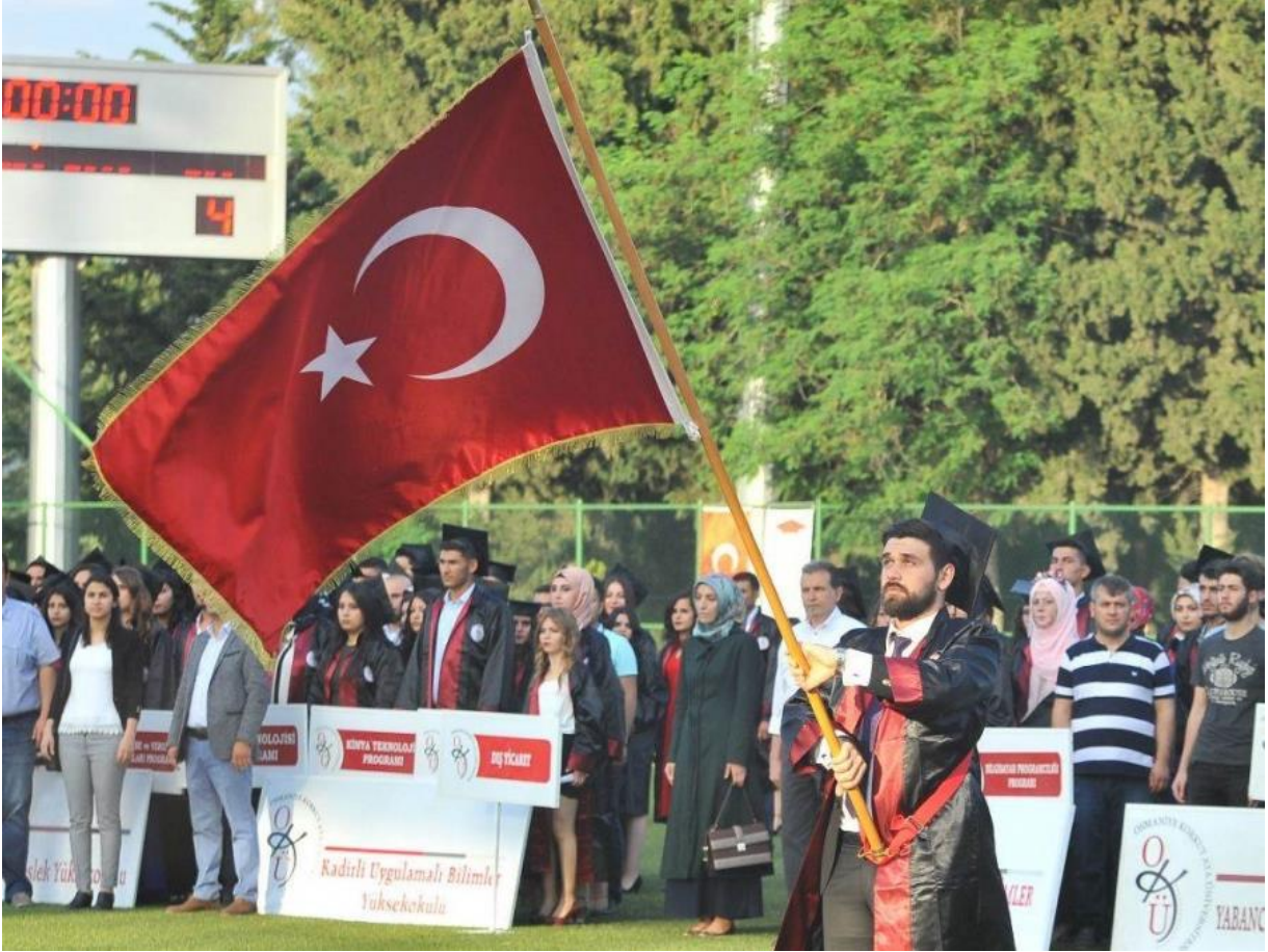
Resim 8: OKÜ Mezuniyet

8- Öğrencilerin ve halkın kullanımına yönelik içerisinde sauna ve buhar hamamı bulunan 1 yarı olimpik yüzme havuzu, halı saha, 2 tenis kortu, FİFA standartlarına uygun çim saha, fitness salonu, 2 squash salonu, çeşitli spor alanları, önlisans, lisans ve lisansüstüne yönelik laboratuvarlar donanımlı çalışma alanları aktif olarak hizmet vermektedir.