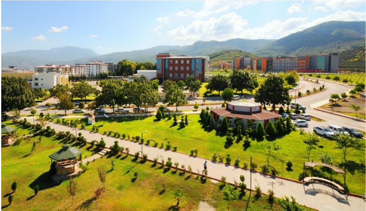
Resim 1: OKÜ Karacaoglan Yerleşkesi

Yükseköğretim kurumları olarak amacımız; yüksek düzeyde bilimsel çalışma ve araştırma yapmak, bilgi ve teknolojiyi üretmek, bilim verilerini yaymak, ulusal alanda gelişme ve kalkınmaya destek olmak, yurtiçi ve yurtdışı kurumlarla işbirliği yapmak suretiyle bilim dünyasının seçkin bir üyesi haline gelmek, evrensel ve çağdaş gelişmeye katkıda bulunmaktır.